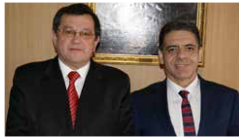
• El Gobernador Provincial de Llanquihue; Juan Carlos Gallardo .