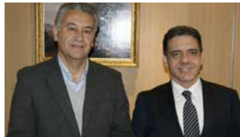
• El Gobernador Provincial de Quillota; César Barra .